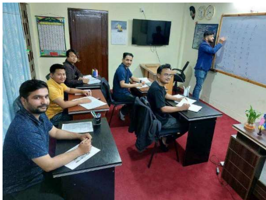
第2期5名のネパール人材に対する日本語教育の様子

また第2期5名のネパール人材についても、事前に日本企業就職内定を得たうえで、8月より日本語教育を開始しており、12月末までの日本語能力 N4 相当の教育カリキュラムを実施します。