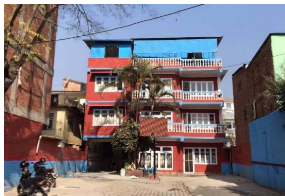
現地に開設した教育施設