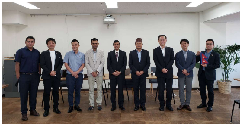
在日本ネパール国大使館参事官アンビカ ジョシ氏との集合写真 (写真中央)

結果的に、本事業のクライアントはネパール人材の技術能力を高く評価していることに繋がっているため、日本の IT 産業発展にネパールの強みを活かしていることを評価しています。